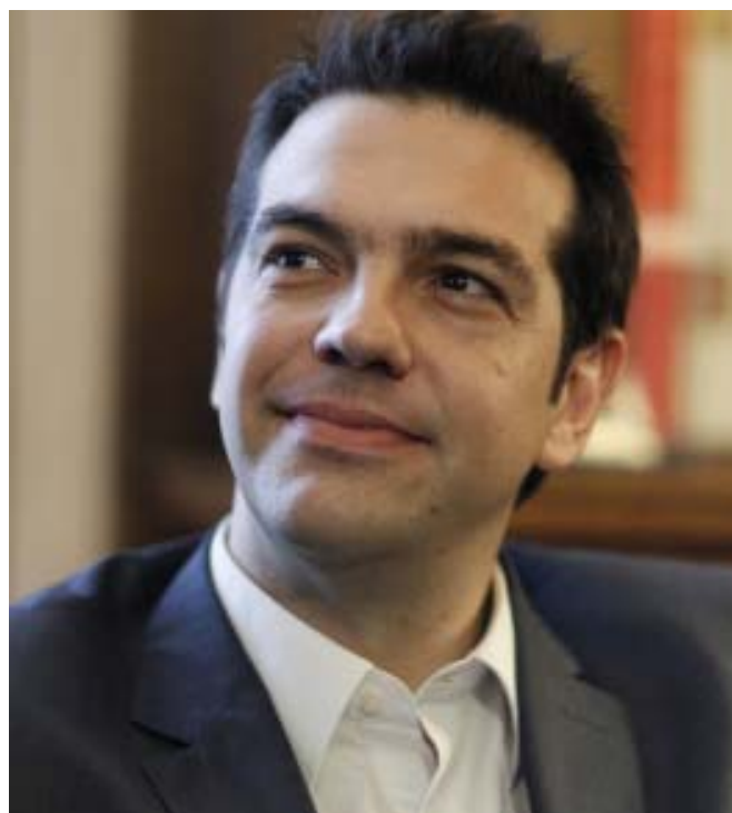
Alexis Tsipras, Greklands premiärminister

Dessa förslag direkt strider mot de europeiska sociala och grundläggande rättigheterna; de visar att "institutionernas" krav inte är ett livskraftigt