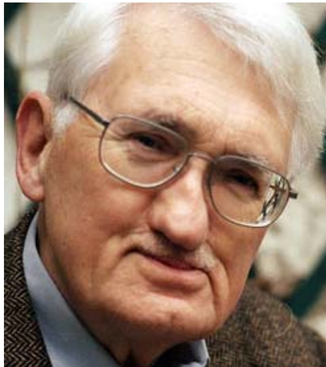
Den tyske filosofen Jürgen Habermas

Efter regeringsskiftet i Grekland tog Draghi, som simmar mot den tröga strömmen av kortsiktig, ja, huvudlös politik, genast till orda: "Vi måste komma bort från ett regelsystem för nationell