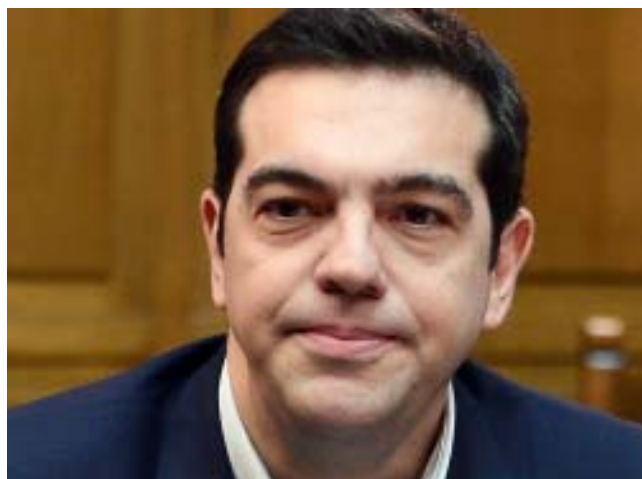
GREKLANDS PREMIÄRMINISTER ALEXIS TSIPRAS

På Omoniatorget, Aten, i valrörelsens slutskede var det många som började tro på ett nytt Grekland och ett nytt socialt EU när Alexis Tsipras hand i hand med Paulo Iglesias anträdde scenen till "First we take Manhattan, then we take Berlin". Syrizas valvinst hade kunnat innebära ett keynesianskt projekt där människor går före profit. Men något Varoufakis och Tsipras borde vara smärtsamt medvetna om nu efter många ronder med EU är att det fortfarande är samma Tyskland som det ska förhandlas med och samma eurosamarbete som Grekland ska tillhöra. Ramarna för förändringen som Syriza pratade om i valrörelsen är mycket begränsade. Att verka för ett socialt Europa är omöjligt så länge Lissabonfördraget, och allt vad det innebär, är det som gäller. Den nu rådande synen på underskott är inskriven i fördraget och att marknadens frihet går före allt är sånt som i en vanlig kontext skulle betraktas som en högeragenda.