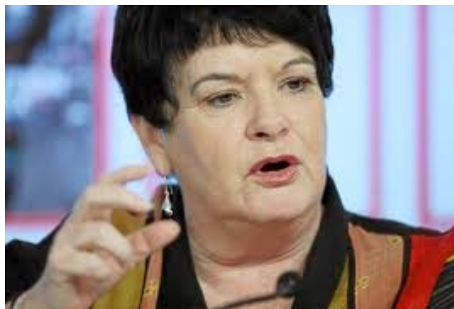
ITUC:S GENERALSEKRETERARE SHARAN BURROW

ITUC:s rapport drar slutsatsen att en hållbar tillväxt, anständiga arbetstillfällen för alla, ekono-