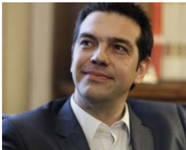
GREKLANDS PREMIÄRMINISTER ALEXIS TSIPRAS